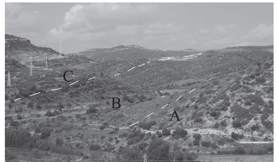
Figura 2 | Foto panoràmica del jaciment del Barranc de la Torre Folch. A) Formació Margues i calcàries de les Artoles. B) Fm. Argiles de Morella. C) Fm. Calcàries i margues de Xert.

Pel damunt es troben 78 metres d'una alternança de trams de lutites (rogenques i grises) amb alguna passada calcària i trams predominantment arenosos amb cossos de morfologia lenticular. Les arenoses presenten estratificacions encruades planars i de solc, així com laminació planar. Sovint s'aprecien nivells de microconglomerats a la base dels canals i bioturbació al sostre. La granulometria és de fina a mitja. La part mitja i superior d'aquesta unitat presenta fragments carbonosos vegetals. S'observa també un canvi en la coloració dels cossos arenosos, grisencs a la part baixa i ocres cap als 2/3 superiors, denotant condicions d'ambient sedimentari de menor profunditat de làmina d'aigua a la base de la formació. Aquesta unitat s'interpreta com una plana deltaica d'inundació amb influència mareal, (Salas,